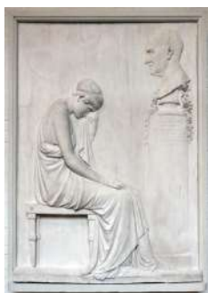
ANTONIO CANOVA (Possagno, 1757 – Venezia, 1822)