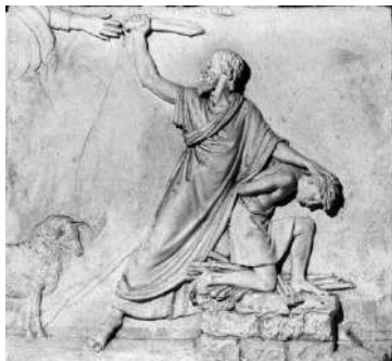
Sacrificio di Isacco