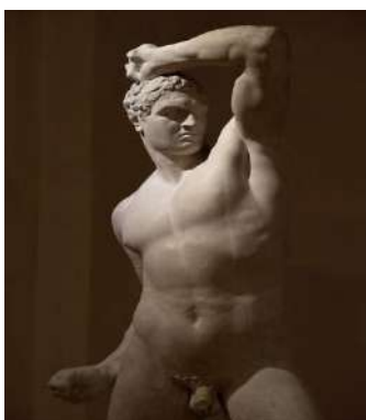
ANTONIO CANOVA (Possagno, 1757 – Venezia, 1822)