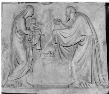
Presentazione di Gesù al tempio