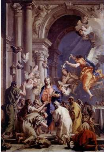
GIANDOMENICO TIEPOLO (Venezia 1727 - 1804)