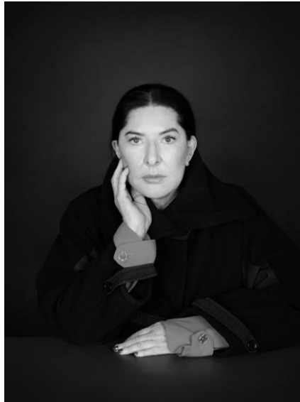
Ritratto dell'artista Marina Abramović by Marco Anelli, 2025

A Venezia - città che per secoli è stata crocevia di cultura, commercio e circolazione di materiali rari - l'uso di quarzo, ametista e altri elementi naturali da parte della Abramović risuona con la storia del mosaico veneziano e con la ricerca rinascimentale della trasformazione materiale e metafisica. Ponendo il corpo del visitatore al centro dell'opera, la mostra invita a una forma di sguardo duraturo: una forma che non è tanto di osservazione passiva quanto di presenza, partecipazione e possibilità di cambiamento interiore.