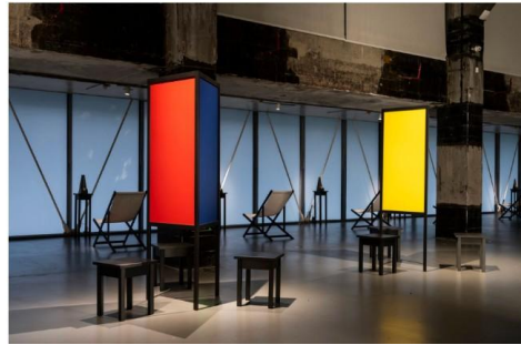
"Transforming Energy" Marina Abramović, Modern Art Museum (MAM) Shanghai; Crediti: Yu Jieyu

Inaugurazione il 6 maggio 2026 - per celebrare l'80° compleanno dell'artista